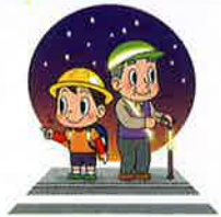
左右を確認しよう!