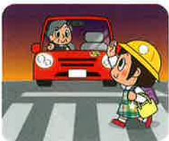
歩行者を優先しよう! 早めにライトを点灯しよう!