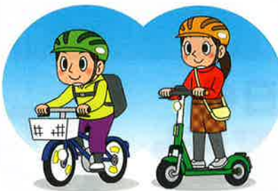
ヘルメットを着用しよう!