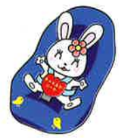
チャイルドシート着用推進 シンボルマーク「カチャビョン」