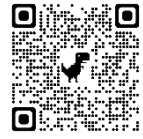
朝日中 HP QRコード